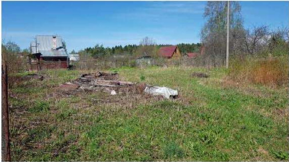
Земельный участок 50:01:0060345:455 МО Талдомский район д. Приветино.